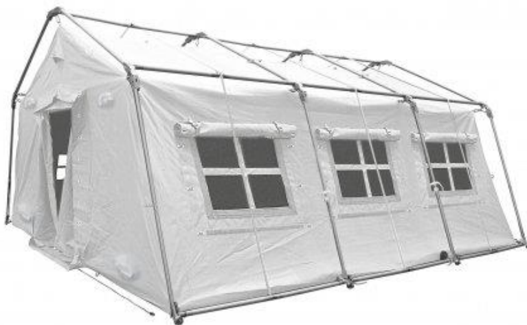
Tenda Ferrino MV 6x6 a montaggio rapido con esoscheletro

Tenda Ferrino MV 6x6 a montaggio rapido corredata di telo ombra, con doppia entrata e predisposizione per climatizzazione, passaggio delle connessioni elettriche ed installazione dei corpi illuminanti.