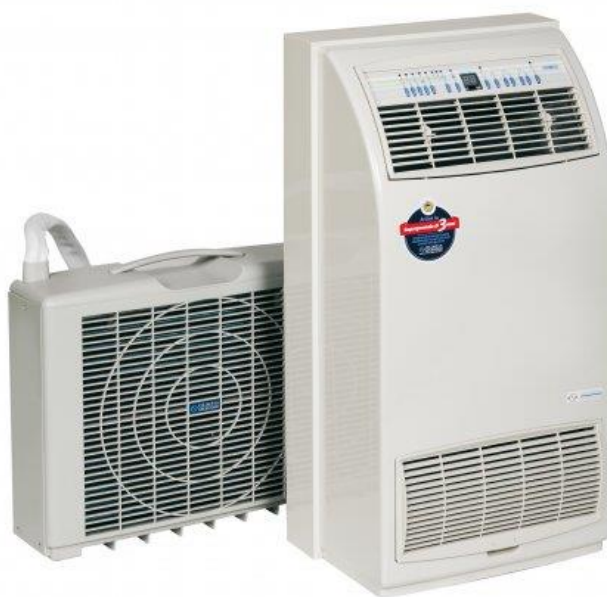
Climatizzatore Portatile 6000 BTU con funzione pompa di calore