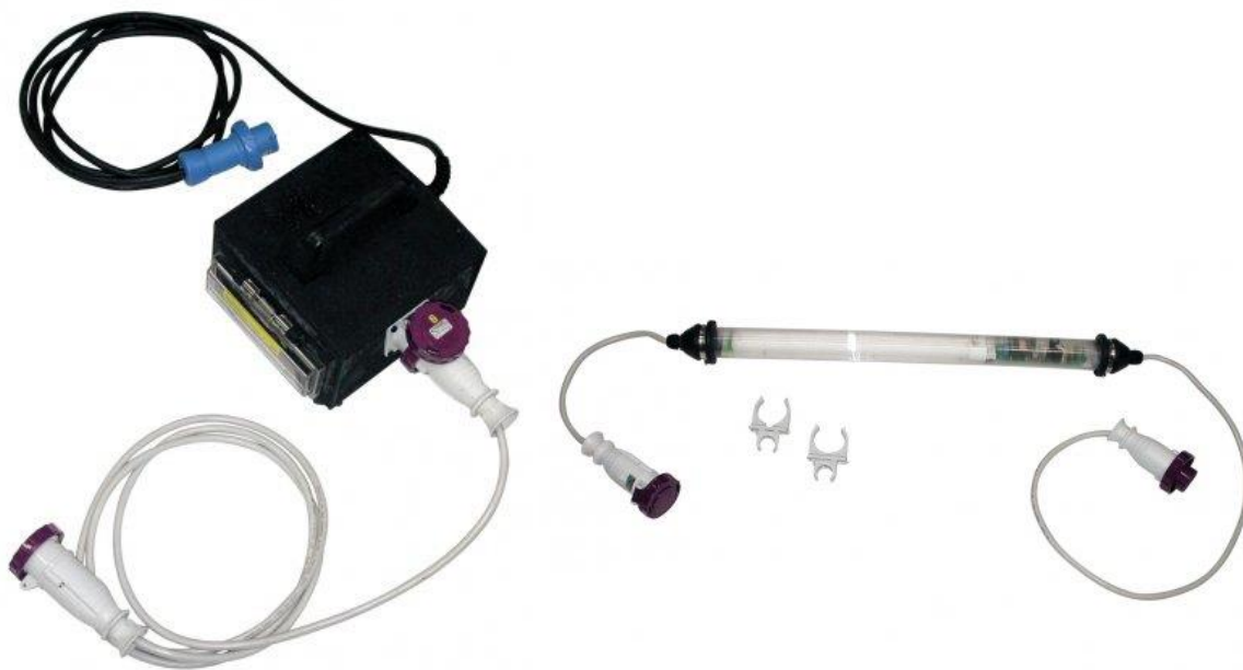
Trasformatore antiurto 230V con interruttore magnetotermico e salvanita e corpo illuminante da interno.