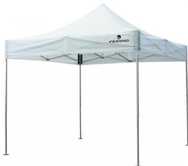
Tenda Modulare Rapida 3x3 con caratteristiche ignifughe.

L'allestimento interno della tenda ha caratteristiche modulari per poter essere adattato alle differenti esigenze operative, il kit di base si compone di: